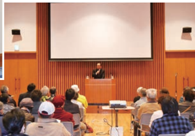
道の駅-湧水の郷 しおや- (塩谷町)にて