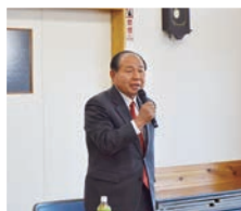
千渡公民館 (鹿沼市)にて

引き続き、野党の役割であるチェック機能を果たすため、鋭く、厳しく、糺してまいります。