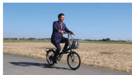
地域でのあいさつ回り