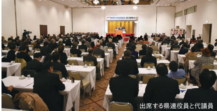
出席する県連役員と代議員

3月26日、民進党栃木県連は宇都宮市内にて約200名の代議員参集のもと「民進党栃木県総支部連合会 第2回定期大会」を開催しました。