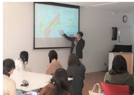
学生に向けた医療講座