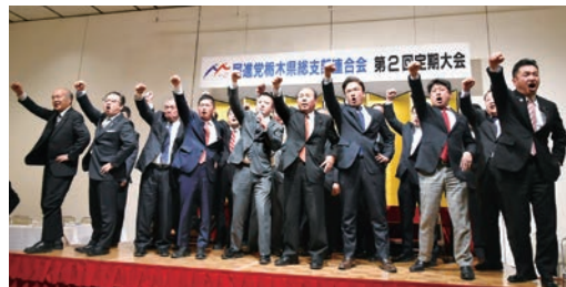
出席者全員での「頑張ろう三唱」

大会最後に、栃木県連の結束と衆議院議員総選挙および自治体議員選挙全員の必勝に向けた『頑張ろう三唱』を参加した党員・サポーターとともにを行い、幕を閉めました。