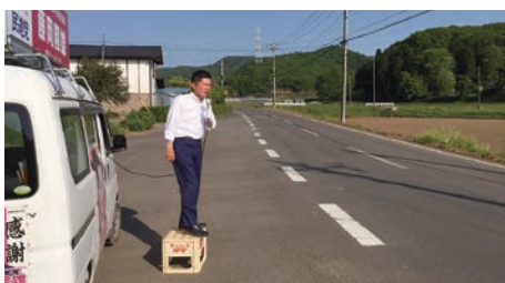
定期的な街頭演説活動

この度は、黨員・サポーターのご登録を賜り、心から感謝いたします。最近も地域を挨拶にまわっておりますが、改めて与党で吸い上げられていない沢山の声があると感じます。中山間地域ではイノシシ被害に苦しむ声、将来の不安や雇用にも悩み結婚が難しくなっている現実、正社員の職が得られない、保育園に入れないなど多くの厳しい現実を目の当たりにしております。地域に目が向き、地域に人が集まる日本を目指して、一身を捧げて頑張りますのでご指導賜れば幸いです。