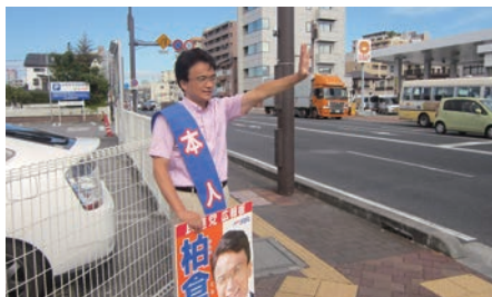
宇都宮市内各所で行っている朝街宣

2年前より「今年は勝負の年」と言い続けて来ましたが、今年こそは本当に勝負の年となります。「政治は数」を思い知らされた日々でしたが、その弊害そして二大政党制の必要性も痛感しながら活動して参りました。党勢は芳しくありませんが、逆境で頂いた支持こそが自身の血となり骨となっていくはずで。栃木1区の地固め、支持拡大に怠りなき様、一日一日丁寧に励んで参りますので引き続きのご支援よろしくお願い致します。