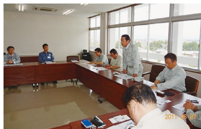
南相馬市役所にて

6月議会を控え、大地震・大津波による被災状況とともに、福島第一原発事故の影響状況を調査するため福島県南相馬市および全村民が避難することになっている飯館村を訪問しました。