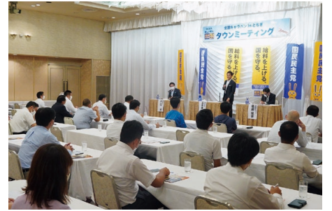
▲タウンミーティング

タウンミーティングでは、党勢拡大や政策、地方組織の強化、外国人技能実習生の問題、空き家対策、コロナ対策など様々な意見や提案がなされ活発な意見交換が行われた。