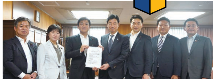
左から、竹詰仁参議院国対副委員長、舟山康江参議院議員会長兼両院議員総会長、玉木雄一郎代表、西村康稔経済産業大臣、浅野哲エネルギー調査会長、田中健国対副委員長、磯崎哲史副代表

本パッケージはエネルギー価格が高騰を続ける中、さらなる電気代の上昇に直面する国民生活を支えるために、多面的な家計支援策とともに、今夏の冷房使用控えによる熱中症を予防する策を提起するものです。