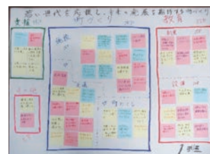
高校生による発表資料

栃木市議会では毎年11月に議会報告会を実施しています。令和4年度は、新型コロナと原油価格・物価高騰対策について議会から提言した内容および令和3年度決算の審査について報告いたしました。また、今年度の議会としてのテーマである「若者世代の投票率向上」を目的とした主権者教育の一環として、高校生との意見交換会を市内8校に議員が訪問し「もし私が栃木市議会議員になったら」を題材にワークショップ形式で意見交換会を実施しました。議会の役割や議員との意見交換を通じて政治に関心を持っていただき、政治参加の一助になればと考えます。