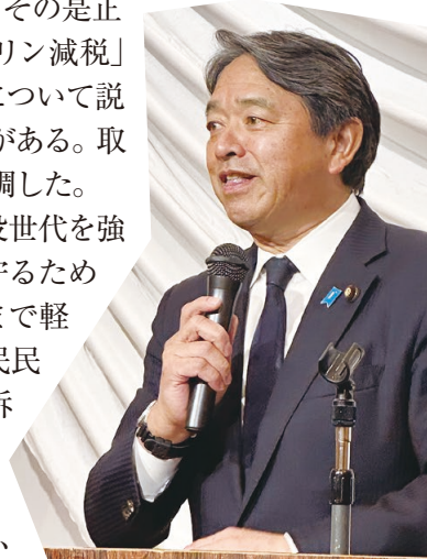
榛葉賀津也幹事長

参加者からは、現場目線で語られる政策論に熱心に耳を傾ける姿が見られ、地域と国政をつなぐ重要な機会となった。